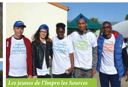
Les jeunes de l'Impro les Sources