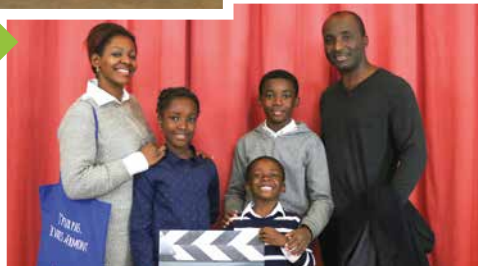
Les nouveaux habitants ont participé à une séance photo.

Autour d'un petit-déjeuner, les nouveaux habitants ont pu rencontrer le personnel municipal et les élus et se renseigner sur les différents services de la ville.