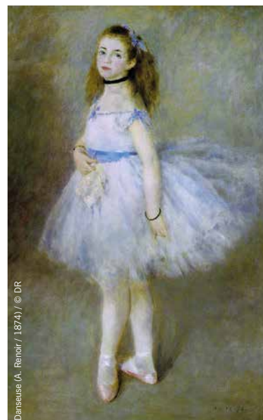
Danseuse (A. Renoir / 1874)

➤ Cycle suivant à partir du lundi 25 novembre à 14 h Abonnement : 31,50 € / séance : 7,50 € / carte 10 entrées : 48,50 €