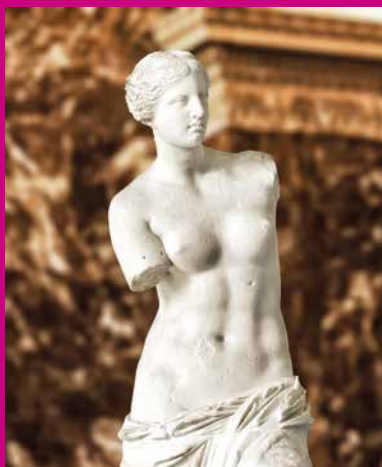
Vénus de Milo

➤ Vendredi 15 novembre à 10 h / tarif : 23 € Informations au 01 34 44 03 85