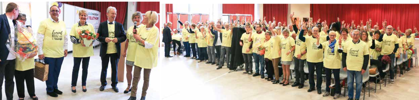
Samedi 12 octobre, la ville d'Ermont et l'AFM-Téléthon organisaient une cérémonie officielle avec passage de flambeau avec le village 2018 de Beaumont sur Oise, témoignages et rencontres entre bénévoles.