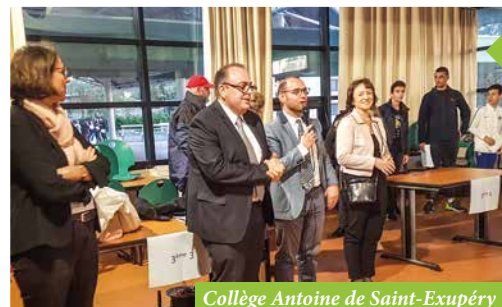
Collège Antoine de Saint-Exupéry

Les collégiens Ermontois fraîchement diplômés se sont vus remettre le Brevet des collèges sous les yeux admiratifs de l'équipe municipale et des familles !